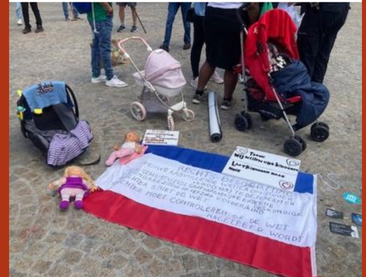
A demonstration last year on behalf of families involved in the childcare benefits scandal.

Hearings started this week in a wide-ranging inquiry into the Dutch government's anti-fraud policies in the last 30 years, including accusations that officials deliberately targeted families and benefit claimants from ethnic minorities.